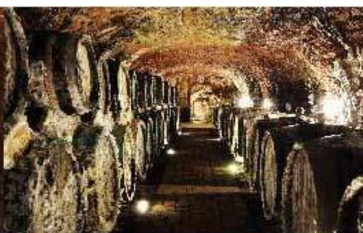
Zde zraje Král vín ... Tokaj